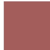
MARSALA PANTONE 1438

La versione Grigia è in polipropilene CL1