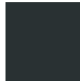
ANTRACITE RAL 7016