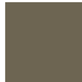
TORTORA RAL 7006